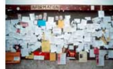
Anslagsstavlan på klubben har sina begränsningar!

Borås Ultralätt Flygklubb är Sveriges (näst?) största flygklubb inom UL-flyget. Vi har i dagsläget lite drygt hundra betalade medlemmar. För att en klubb av den storleken skall fungera krävs många saker. Engagerade medlemmar är en huvudpunkt! Men engagemang kräver att medlemmarna är informerade om klubbens verksamhet i stort som i smått. Därför detta informationsblad.